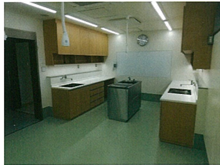
検査・処置室 (手術室併設)